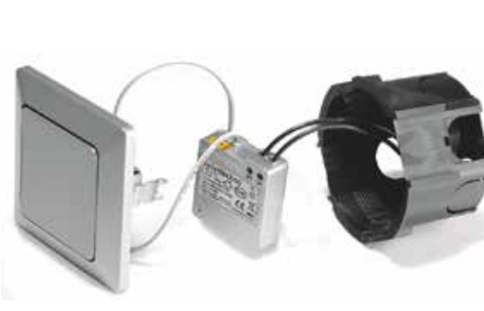
Lihtne lüliti tahaga paigaldus