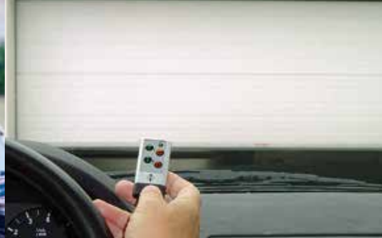
Soodne lahendus garaaživära avamiseks – kõigi ajamite jaoks