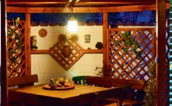
Valgustus majas ja aias