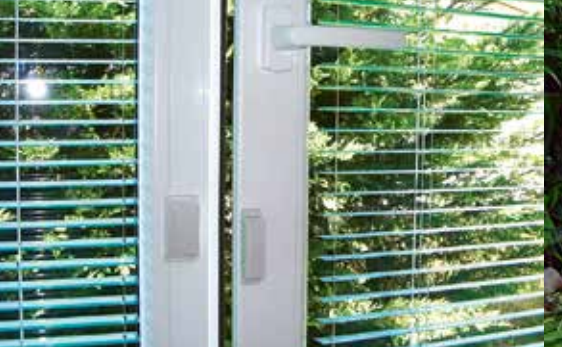
Turvalisus tänu juhtmevabale magnetlülile