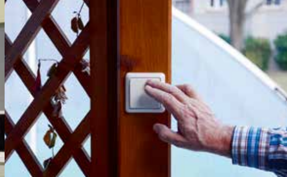
Traadita lülitus aias