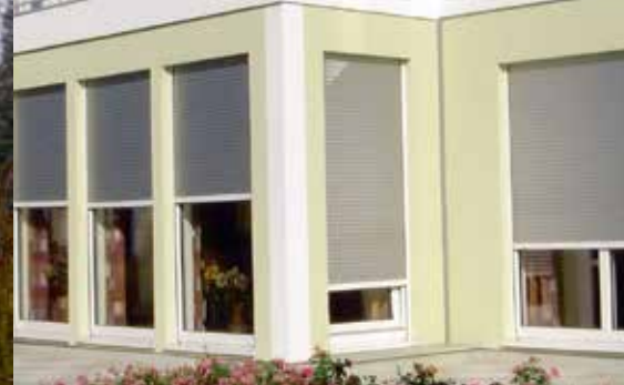
Ajastatud lülitus – hommikune äratus õigel ajal