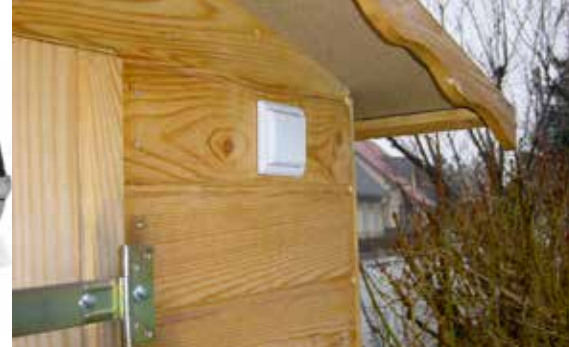
Igale poole kerge paigaldada – pingevaba lülitus